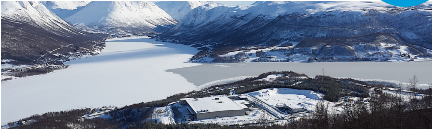
ASKO NORD på Minken utenfor Tromsø.

Effektiv distribusjon av dagligvarer er viktig for samfunnet. Lavere enhetskostnader demper prisveksten, og samtidig nyter både engroskunder og forbrukere godt av hyppige leveranser, bredere sortiment og bedre holdbarhet.